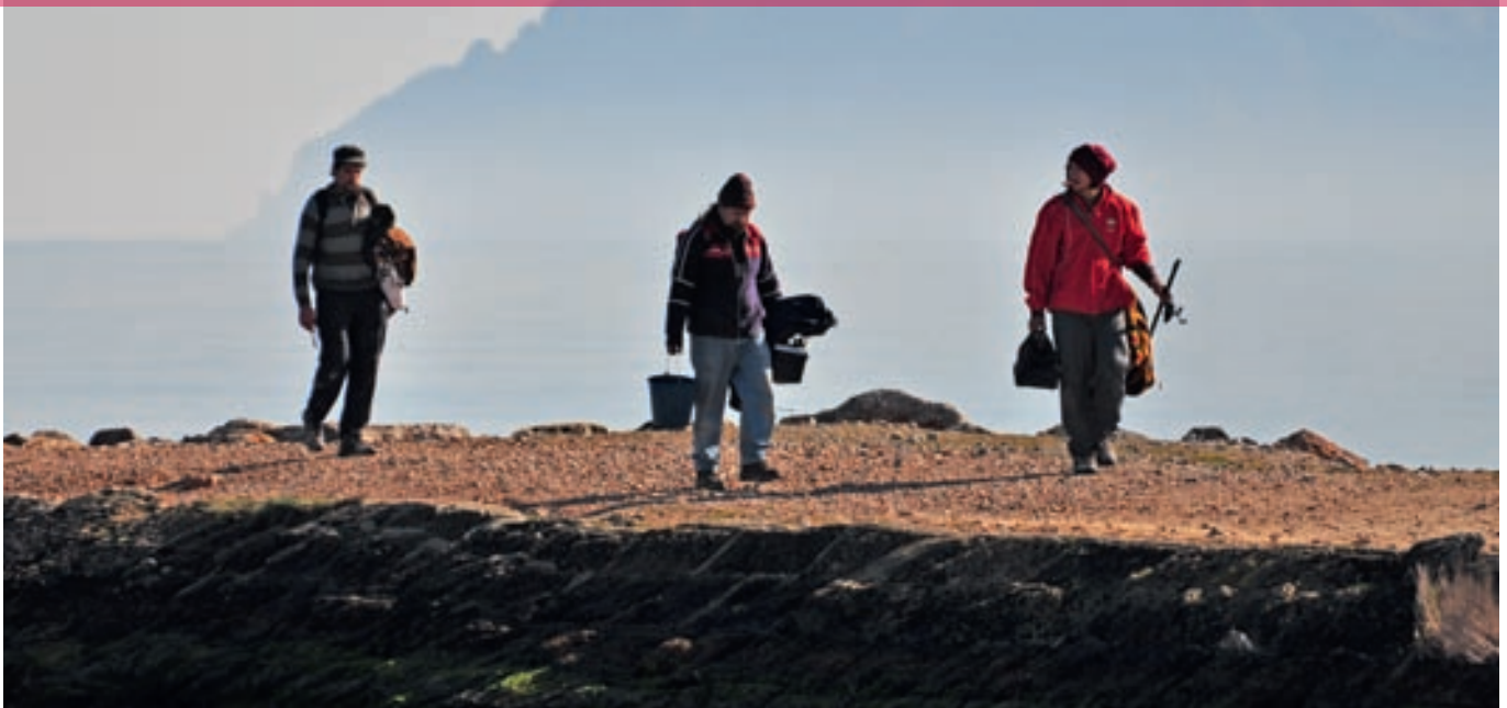
Pescadores recreativos después de una jornada en la Bahía de Alcúdia, Mallorca.

La pesca recreativa en las Illes Balears representa una actividad de gran importancia, tanto por el número de aficionados que la practican como por su importancia socioeconómica. Aunque su práctica está actualmente en auge, la afición de la población balear por la pesca recreativa no es reciente. A finales del siglo XIX, el archiduque alemán Luis Salvador de Austria ya puso de manifiesto su importancia en las islas 1 .