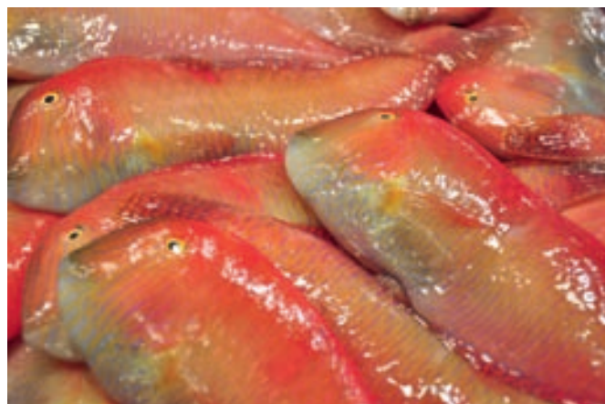
Raor ( Xyrichtys novacula ), especie muy valorada por los pescadores recreativos en Balears.