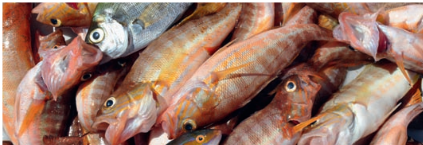
Especies características de la pesca recreativa desde embarcación, capturadas con aparejo de volanti.

Si comparamos las capturas estimadas de la pesca recreativa en las Illes Balears con las del resto del Mediterráneo europeo, tenemos que, según la UE, la pesca recreativa representaba el 10% de las capturas totales en 2004, por lo que la proporción de las capturas en el archipiélago balear representan algo más del doble que en el resto del Mediterráneo europeo.