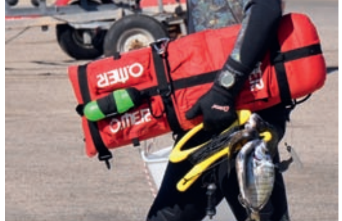
Pescador submarino con sus capturas de la jornada, en la isla de Mallorca.

Se han detectado varios problemas asociados a la expansión de esta actividad, y no son pocas las infracciones registradas en el sector pesquero recreativo. Entre ellas destacan la pesca en ausencia de licencia, no respetar las vedas establecidas, sobrepasar el número de aparejos establecido, la venta ilegal de las capturas, la pesca en áreas prohibidas o rebasar los cupos establecidos 3,4 .