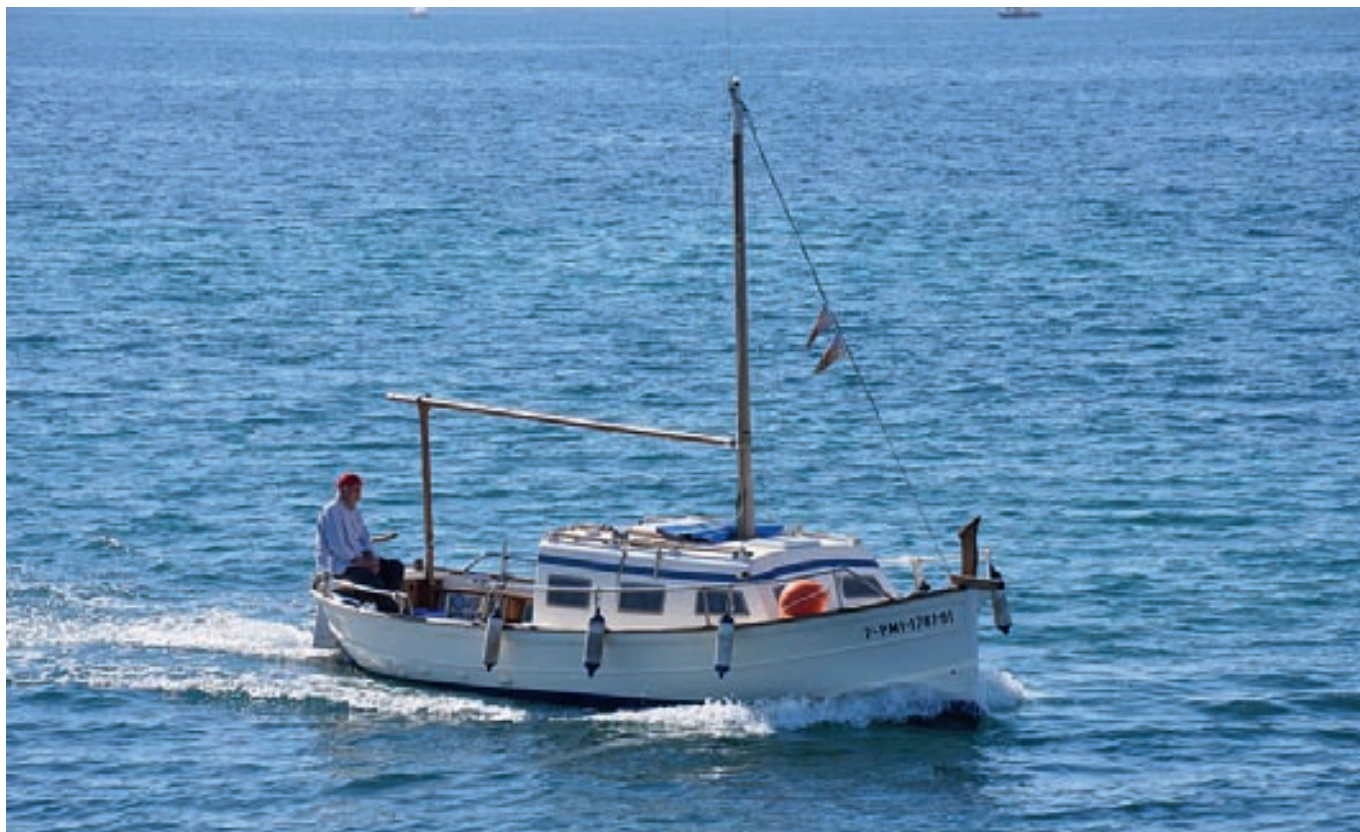
Llaüt , embarcación típica usada para la pesca recreativa en aguas de Mallorca.

Se estima que muchos de los recursos pesqueros de la franja costera (de 0 a 40 m, rango batimétrico en el que se desarrollan las principales actividades de la pesca recreativa) se encuentran sobreexplotados e incluso se considera que la principal causa de esta sobreexplotación es la pesca recreativa y, en particular, la pesca submarina 6,14,15 .