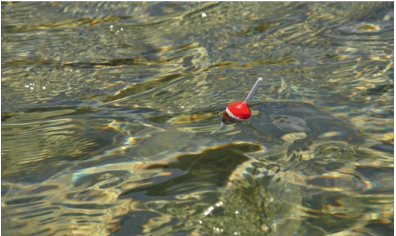
Pesca con suret en la isla de Menorca.