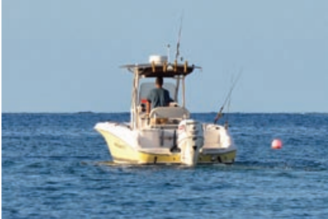
Pescador recreativo con la modalidad de curricán en el norte de Menorca.

Recientemente se ha establecido un tamaño mínimo de anzuelo de 7 mm para evitar capturas de ejemplares juveniles en tres reservas de Mallorca. La única excepción es el raor, para el que este tamaño es de 5,7 mm.